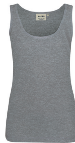
015 grau meliert