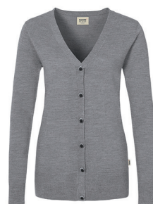
315 dunkelgrau meliert