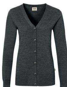
328 anthrazit meliert