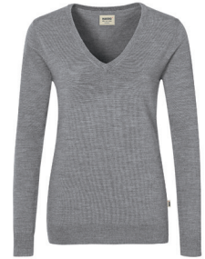
315 dunkelgrau meliert