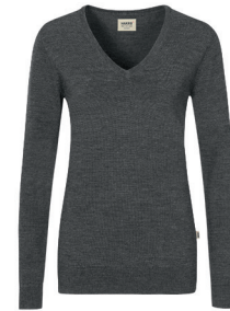
328 anthrazit meliert