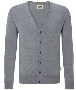
315 dunkelgrau meliert